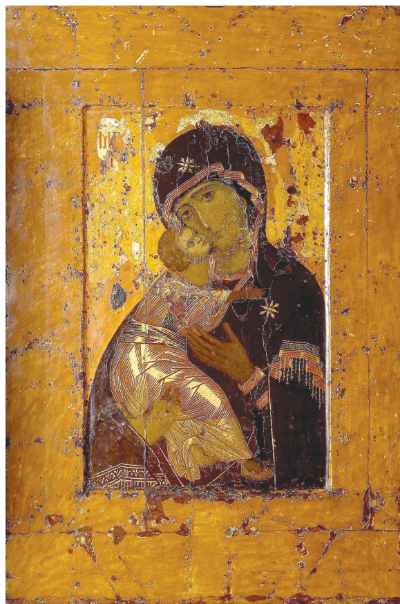
Владимирская икона Пресвятой Богородицы. Константинополь. XII в.

Сам царь Иван глубоко почитал чудотворный образ. Перед ним он молился накануне военных походов и совершал благодарственные молебны по возвращении. В преддверии нового крупного набега крымского хана Девлет-Гирея с объединенным татарским войском на Москву, лишившуюся оборонительных укреплений во время набега и